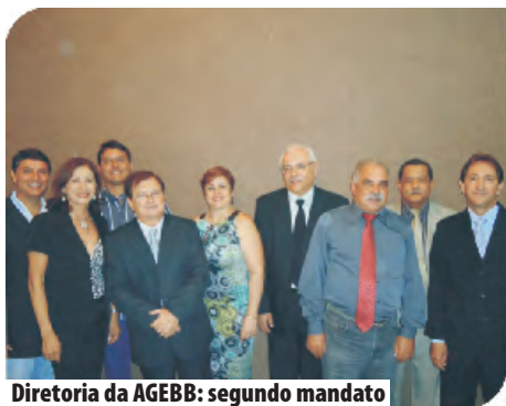
Diretoria da AGEBB: segundo mandato

Os diretores e os representantes do Conselho Deliberativo, eleitos em dezembro, para o mandato de 2012 a 2015,